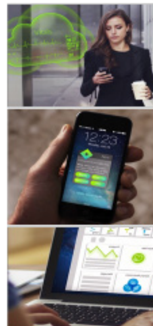
Intelligent assistants: Nora